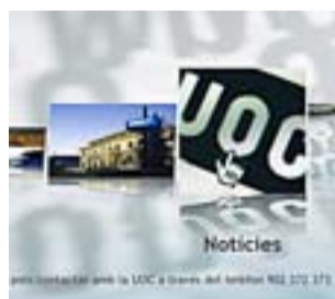
Captura de MediaUOC.

COMUNICACIÓ. La Universitat Oberta de Catalunya (UOC) disposa d'un nou canal de televisió a la carta. Els estudiants podran llegir notícies i consultar les notes amb el comandament a distància del televisor, sempre que tingui connexió a internet. MediaUOC s'estrena 15 anys després de la creació d'aquesta Universitat.